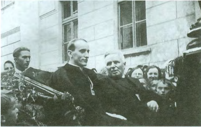
Nadbiskup bl. A. Stepinac pred župnim dvorom u Koprivnici, 23. srpnja 1935.

kost snaga. A ta nejednakost nije u prilog vama, nego protiv vas. Vi imate pet stotina tisuća ljudi u vojsci. Imate bojne brodove. Imate topove. Imate sva pomoćna sredstva, koja vam mogu pribaviti materijalnu prednost. Papa nema ništa od toga. Ali ne zaboravite, da on imade nešto, što vi nemate. Imade moralnu snagu. Imade vlast nad savjestima, nad dušama, čega vi nemate. I ta vlast je neumrla!