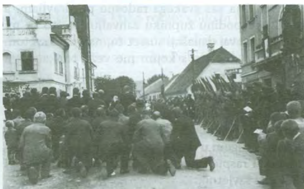
S jedne Tijelovske procesije u Čakovcu. Pobožnost puka plod je i euharistijskog kongresa održanog u Čakovcu 1935.

Čakovečki franjevački samostan i čakovečka franjevačka župa pokazala je i ovom prilikom svoju snagu, jakost ideje sv. Franje.