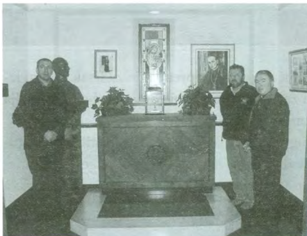
Kapelica urešena slikama bl. A. Stepinca u crkvi američke srednje škole »Archbishop Stepinac high school« u White Plains-u pokraj New Yorka