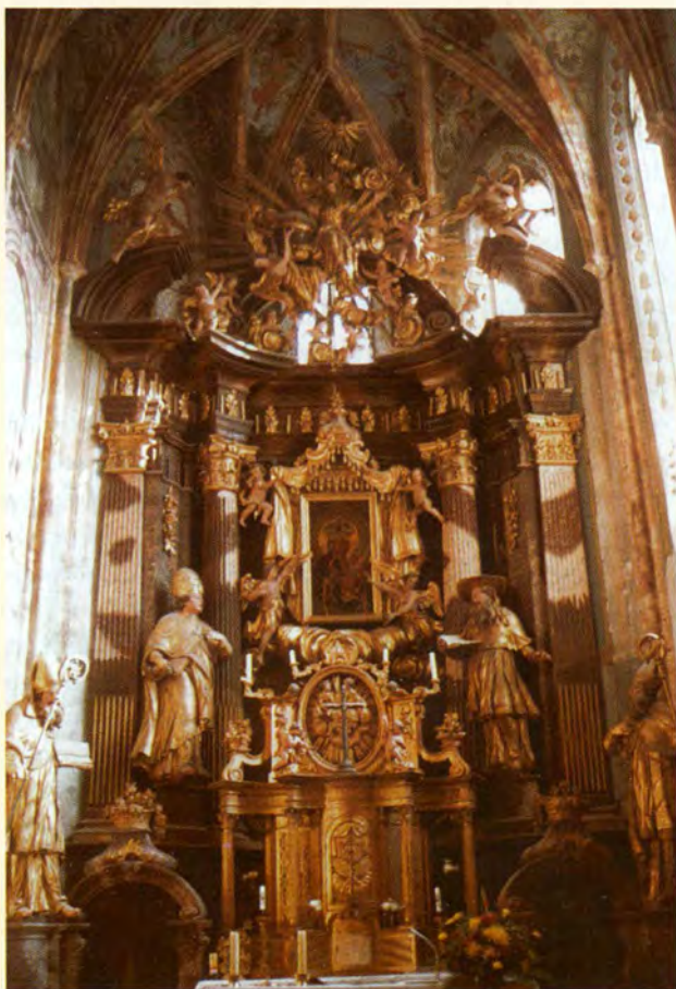
Oltar sa slikom Majke Božje Čenstohovske u župnoj crkvi u Lepoglavi pokraj koje je kao zatvorenik bl. Alojzije proboravio pet godina

Poslušnost i žrtva su si baš tako blizu, kao što su i