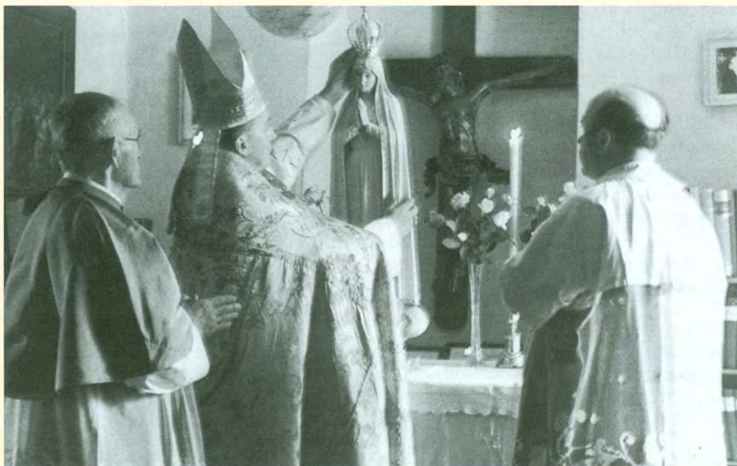
Bf. Alojzije Stepinac kruni kip Majke Božje Fatimske u Krašiću, 31. svibnja 1959. Ovaj se Gospin kip častio u Bijeljini pod naslovom: »Kraljica Orijenta«

3. Činjenica je, da je danas u teškoj pogibelji svećenikova čistoća. Nemoralna ženska moda, svakojako prljavo štivo, kino, stotine namjerno postavljenih zasjeda sa strane neprija-