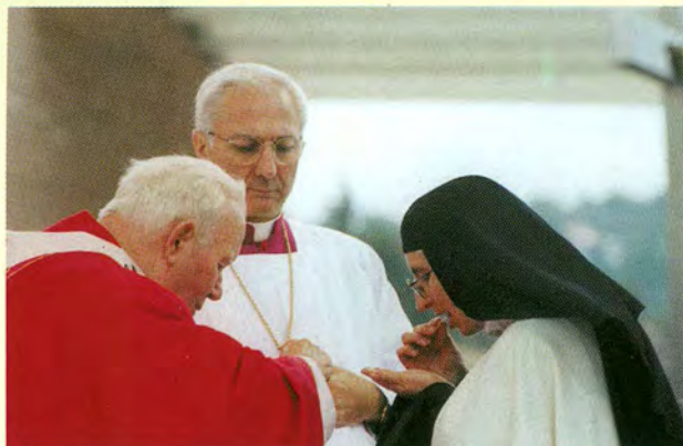
Euharistija je »izvor i vrhunac cijeloga kršćanskoga života« (Lumen gentium, 11) - Ivan Pavao II. podjeljuje sv. pričest na misi proglašenja blaženim kardinala Stepinca, u Mariji Bistrici, 3. listopada 1998.

Za ovogodišnju misijsku nedjelju, koju Crkva slavi 24. listopada, Sveti je Otac 19. travnja uputio posebnu poruku kojom je povezo misijsko poslanje Crkve i Euharistiju kao izvor i nadahnuće toga misijskog poslanja. Donosimo nekoliko izvadaka iz te poruke Ivana Pavla II.