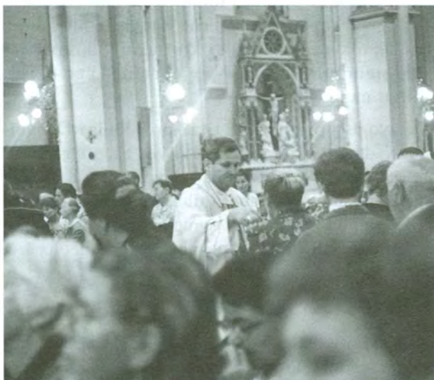
Mons. Vlado Košić podjeljuje sakrament pričesti, u zagrebačkoj katedrali, za vrijeme sv. Mise, na Alojzijevo, 21. lipnja 2004.

Križni put je u crkvi. U moceti ide uz mene od postaje do postaje, a iza nas u redu dva po dva: djeca. »Gledam te naše ministrante i sve računam, koliko još treba godina, da postanu svećenici: 14, 16, 17... Ja bih tada imao 70, 72... E, pa možda i to doživim...« 4