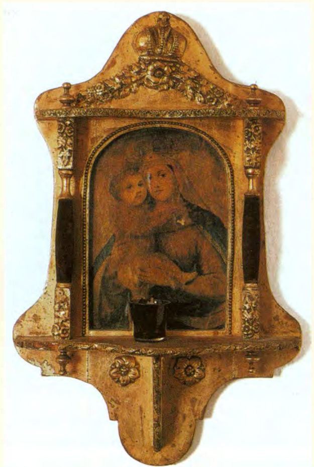
Slika Marije Pomoćnice koja se častila u Alojzijevoj obitelji i pod kojom je on primio milost od najranije mladosti častiti Bogorodicu

I profana povijest i Biblija svašta su nam već zabilježile kroz ovih nekoliko tisuća godina od stvaranja prvoga čovjeka do danas. Zabilježile su nam prvo bračoubrojstvo na zemlji, kad je Kajin ubio Abela. 1 Zabilježile su nam rodoskrvnuća, kad je Juda sagriješio sa snahom svojom Tamarom 2 a Ruben sa ženom oca svojega Jakova, Balom. 3 Zabilježile su nam bune protiv zakonitih poglavara, kad su se Kore, 4 Datan i Abiron pobunili protiv Mojsija i Arona 5 ili buntovni sin Absalon protiv oca svojega, kralja Davida. 6 Zabilježile su nam primjere lakomosti, kad je npr. Nabal uskratio Davidu i njegovim gladnim ljudima korice kruha, makar im je toliko dugovao, a bio tako bogat. 7 Zabilježile su nam primjere najgadnijeg idolopoklonstva, kad su ljudi, obdareni razumom i slobodnom voljom, bacali svoju nevinu djecu u ždrijelo Moloha, ražarenog ognjem. 8 Zabilježile su nam žalosne otpade od Boga živoga, kad se je na primjer najmudriji kralj svijeta, Salomon, kojemu se Bog dva puta osobno javio, odmetnuo od Boga i okrenuo gadnim idolima svojih stotina konkubina poganki. 9 Zabilježile su nam bezbrojne hule na Boga, kao one Antioha, Senaheriba, Holoferna. 10 Zabilježile su nam bezbrojne laži, podvale, krive osude, kao onu, kad je bezbožna Jezabela dala lažno optužiti i ubiti Nabota, da se domogne njegovog vinograda. 11 Zabilježile su nam tolike preljube, klevete, psovke, nečistoću, krađe, pljačke, ubojstva, da se nimalo ne čudimo onome, što kaže Gospodin nakon općeg potopa, kad se Noa iskr-