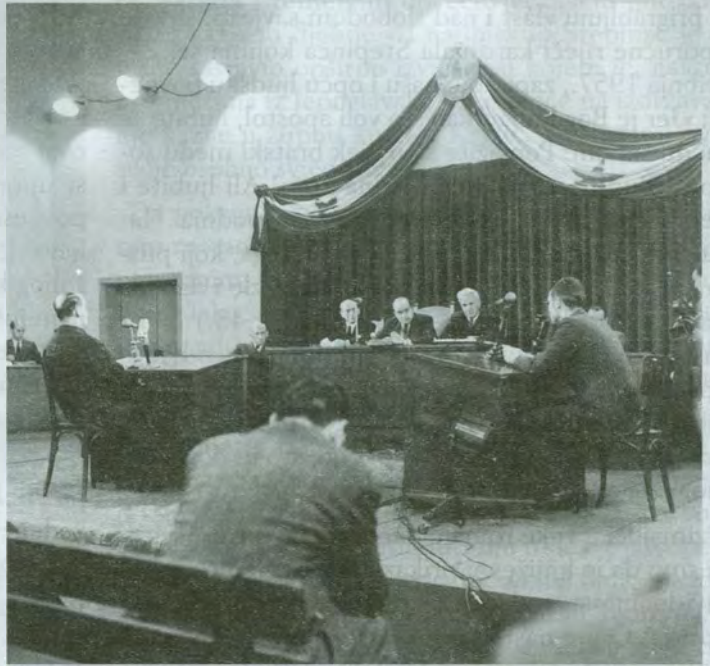
Blaženi Alojzije Stepinac na optuženičkoj klupi jugoslavenskog komunističkog režima u listopadu 1946.

»Svrha je mog procesa po mom mišljenju bila, da me prisile na povlačenje pastirskog pisma Episkopata iz 1945. godine, koje ih je demaskiralo pred čitavim svijetom. Kad u tom nisu uspjeli, nadali su se da će me dugim tamnovanjem barem prisiliti, da molim od njih pomilovanje, koje bi oni dakako rado bili udijelili, ali pod stanovitim uvjetima. Toga nisam mogao učiniti, jer bi se kosilo sa čašću i interesima Katoličke crkve, koji idu pred ličnim interesima pojedinih biskupa. I tako su me konačno morali pustiti bez ikakvih uvjeta barem na ograničenu slobodu pod pritiskom svjetskog javnog mišljenja. Mogao bih napisati čitavu knjigu, što sam sve vidio i proživio. Ali niti je sada vremena niti bih to mogao u miru izvesti, kad nisam ni časa siguran, da mi tko ne provali u stan, jer lična sloboda i sloboda savjesti i dalje ostaje mrtvo slovo u komunističkoj Jugoslaviji. Učinit će to drugi, koji prežive, a koji su bili svjedoci svih strašnih zbivanja prošlog decenija.«