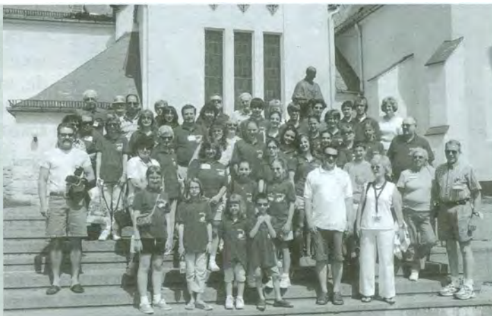
Skupina Hrvata iz države Ohio u SAD-u. pohodila je mjesto Blaženikova sužanjstva 1. srpnja 2004.