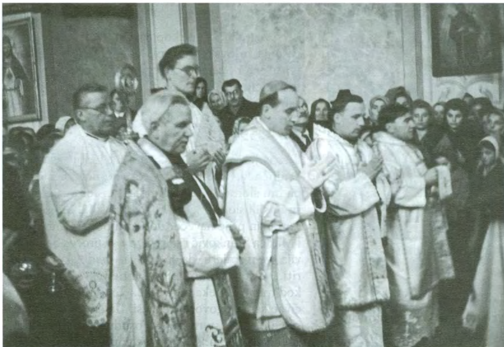
Blaženi Alojzije Stepinac u pastoralnom pohodu župi povjerenoj franjevcima