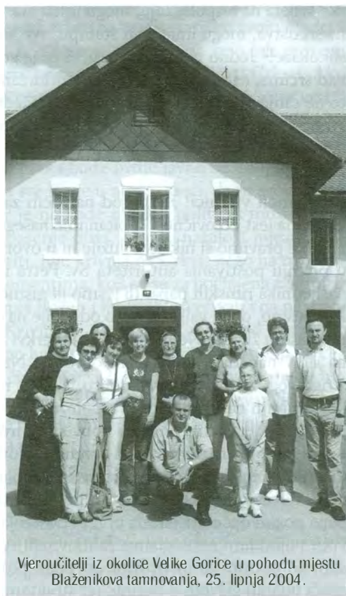
Vjeroučitelji iz okolice Velike Gorice u pohodu mjestu Blaženikova tamnovanja, 25. lipnja 2004.