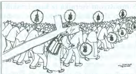
Ivan LACKOVIĆ CROATA, Križni put našega naroda predvodi bl. Alojzije Stepinac, 29,5 x 41 cm, crtež tušem, 2002.

Postulatura mu zahvaljuje za crteže bl. A. Stepinca.