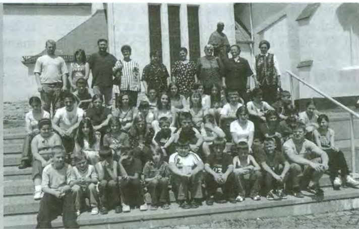
Hodočasnici iz Zrinskog Topolovca predvođeni župnikom hodočastili su u Krašić 7. srpnja 2004.

Pjevanjem je euharistijsko slavlje uveličao zbor mladih župe Marije Kraljice iz Zaprešića. Nakon mise kod sarkofaga blaženika u privatnoj pobožnosti mons. Stanković izmolio je litanije i službenu molitvu bl. Alojzija Stepinca, uz nazočnost mnogih štovatelja. Članovi molitvene zajednice bl. Alojzija Stepinca iz župe Sv. Petra apostola, skupa s mladima iz župe Marije Kraljice apostola iz Zaprešića, položili su svijeće ispred sarkofaga blaženog Alojzija Stepinca za duhovnu i materijalnu izgradnju svojih sestrinskih župa iz Zaprešića.