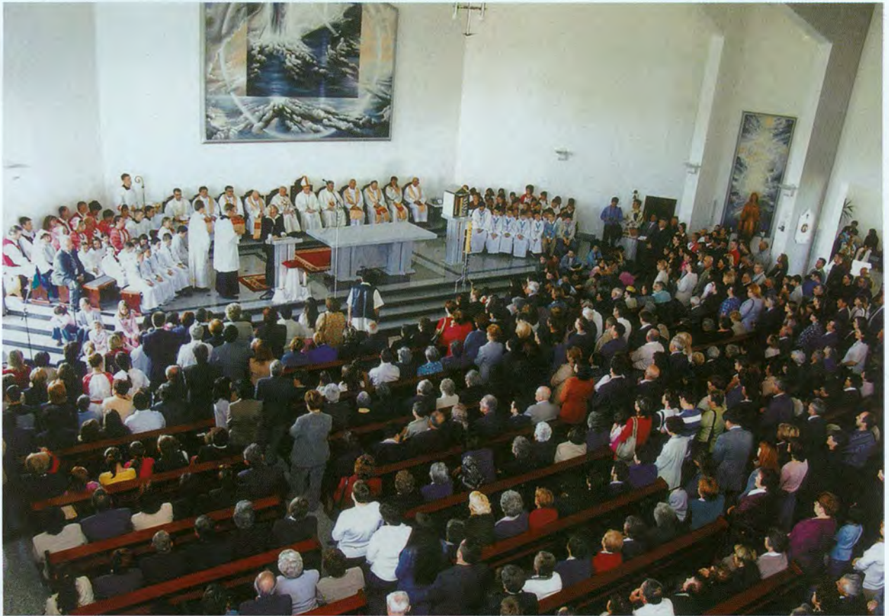
Božji narod okupljen oko svoga nadbiskupa kard. Josipa Bozanića, župnika i brojnih svećenika na euharistijskom slavlju prigodom posvete župne crkve za župu Dobroga Pastira u zagrebačkom naselju Brestju i blagoslova oltara u koji su stavljene moći bl. A. Stepinca, u nedjelju, 2. svibnja 2004.