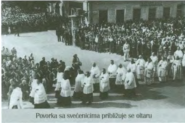
Povorka sa svećenicima približuje se oltaru