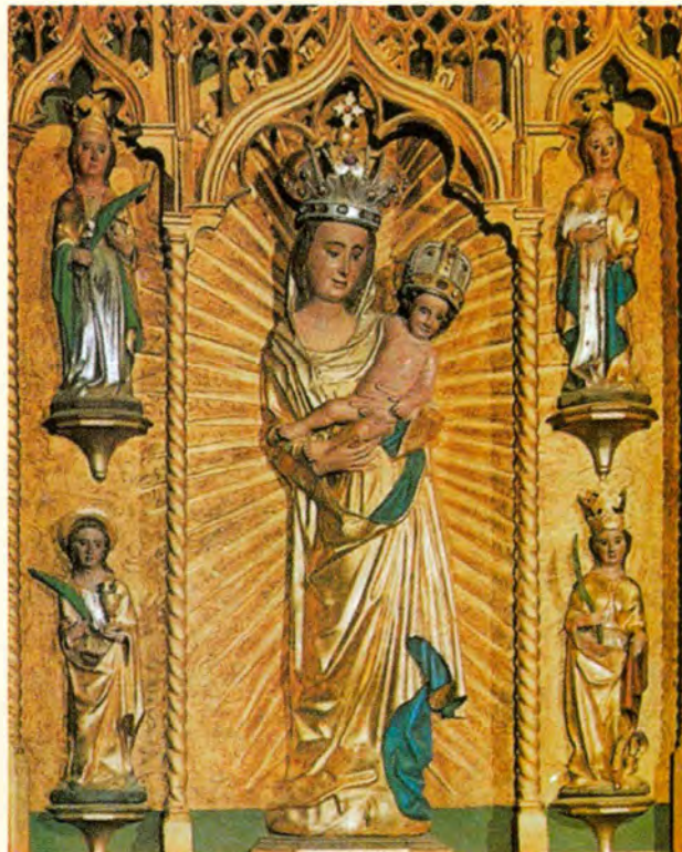
Kao nadbiskup bl. Alojzije je svake godine vodio pokorničko hodočašće u svetišće Majke Božje Remetske

nevjerojatne trijumfe Gospe Fatimske što putuje svijetom u formi kipa kroz sve kontinente, ako dodamo sve više rastuću pobožnost prema neokaljanjoj Majci Božjoj, nisu li sve to predznaci, da je blizu vijek Marijin i njezino slavlje nad paklom, koji je svijet doveo do ruba propasti?