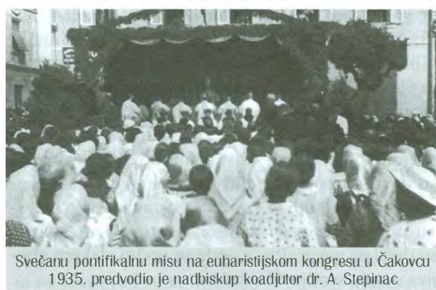
Svečanu pontifikalnu misu na euharistijskom kongresu u Čakovcu 1935. predvodio je nadbiskup koadjutor dr. A. Stepinac