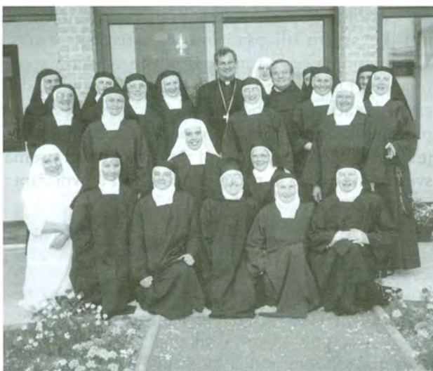
Zajednica ss. Karmela u Mariji Bistrici sa sudionicama zasjedanja Udruge hrvatskih Karmela »Bl. Alojzije Stepinac«, u Mariji Bistrici od 30. lipnja do 2. srpnja 2004. Sa sestrama su na slici i mons. Vlado Košić i o. Jure Zečević, OCD.

U Karmelu u Mariji Bistrici održana je od 30. lipnja do 2. srpnja II. skupština Udruge »Blaženi Alojzije Stepinac« bosonogih karmelićanki u republikama Hrvatskoj i Bosni i Hercegovini pod geslom »Na karmelskom putu zajedno«. Udruzi pripadaju svi hrvatski karmeli: 4 u Hrvatskoj (Brezovica, Kloštar Ivanić, Đakovačka Breznica i Marija Bistrica) te Sarajevo-Stup u Bosni i Hercegovini. Trenutno Karmeli u Hrvatskoj imaju ukupno 78 sestara, od toga 63 sa svećanim i doživotnim zavjetima, 8 sestara s privremenim zavjetima, 5 novakinja, 2 kandidatice i postulantkinje. Prosječna životna dob sestara je 47 godina.