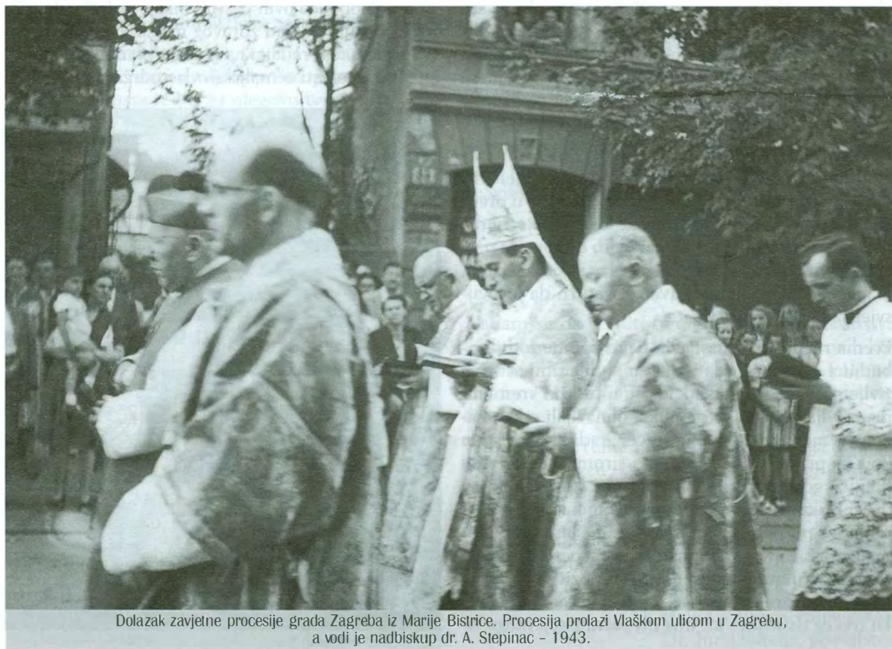
Dolazak zavjetne procesije grada Zagreba iz Marije Bistrice. Procesija prolazi Vlaškom ulicom u Zagrebu, a vodi je nadbiskup dr. A. Stepinac - 1943.

Dok su mučeništva drevnih mučenika kršćanstva zapisana tek nesigurnom rukom povjesničara ili predaje, ova dvojica Kristovih učenika govore puno snažnije: bliži su nam vremenski i »naše su gore list«.