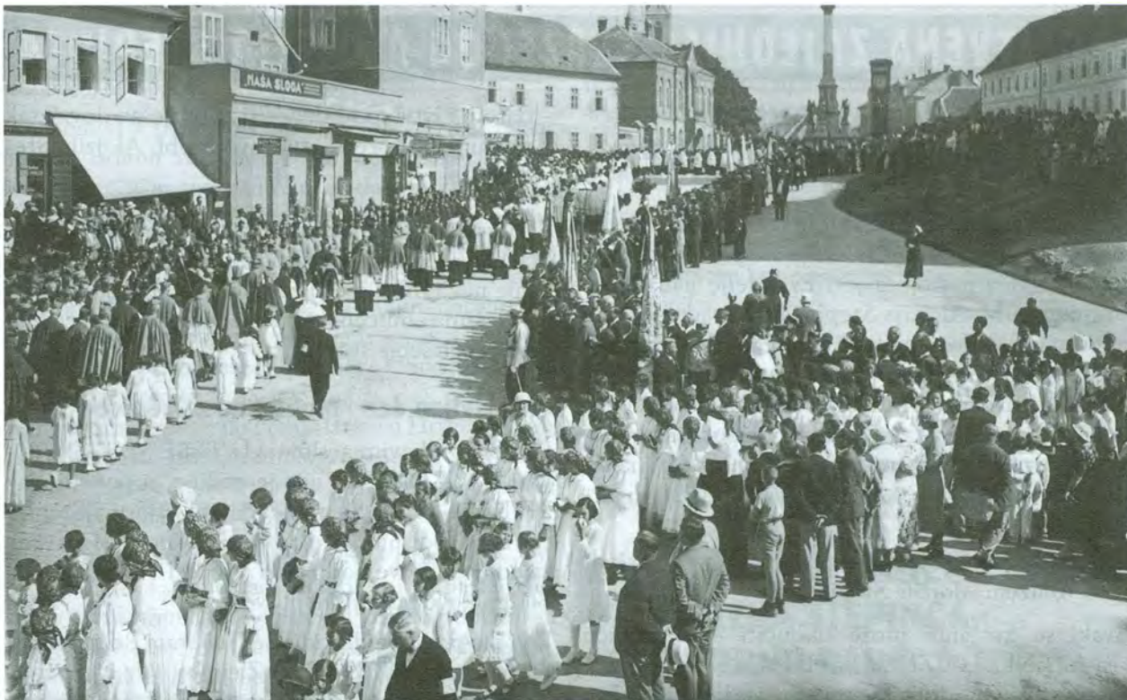
Slika Božjega naroda koji se okupio na biskupsko ređenje nadbiskupa koadjutora Alojzija Stepinca, u Zagrebu, 24. lipnja 1934. Procesija s crkvenim odličnicima Bakačevom ulicom dolazi u Katedralu.

od ropstva starom zakonu, i time naše ponovno rođenje na novi život. Krist je to naše oslobođenje: On je naša sloboda, On je temelj i izvor snage našeg novog života. Dok ostajemo s Njime i u Njemu, bit ćemo oslobođeni od svih zapreka za sretan život u slobodi i ljubavi. Ova naša sloboda i sposobnost ljubiti Boga i bližnjega imat će plodonosne učinke za našu okolinu, za naše društvo. Kršćanska sloboda i kršćanska ljubav nisu naime privatna stvar za vlastitu izgradnju i usrećenje.