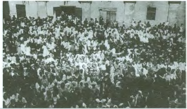
Stari grad knezova Zrinskih u Čakovcu još nikad nije vidio toliko razdragane mladeži kao tijekom euharistijskoga kongresa 1935.

se u redu i miru razišao da se spremi za popodnevnu procesiju.