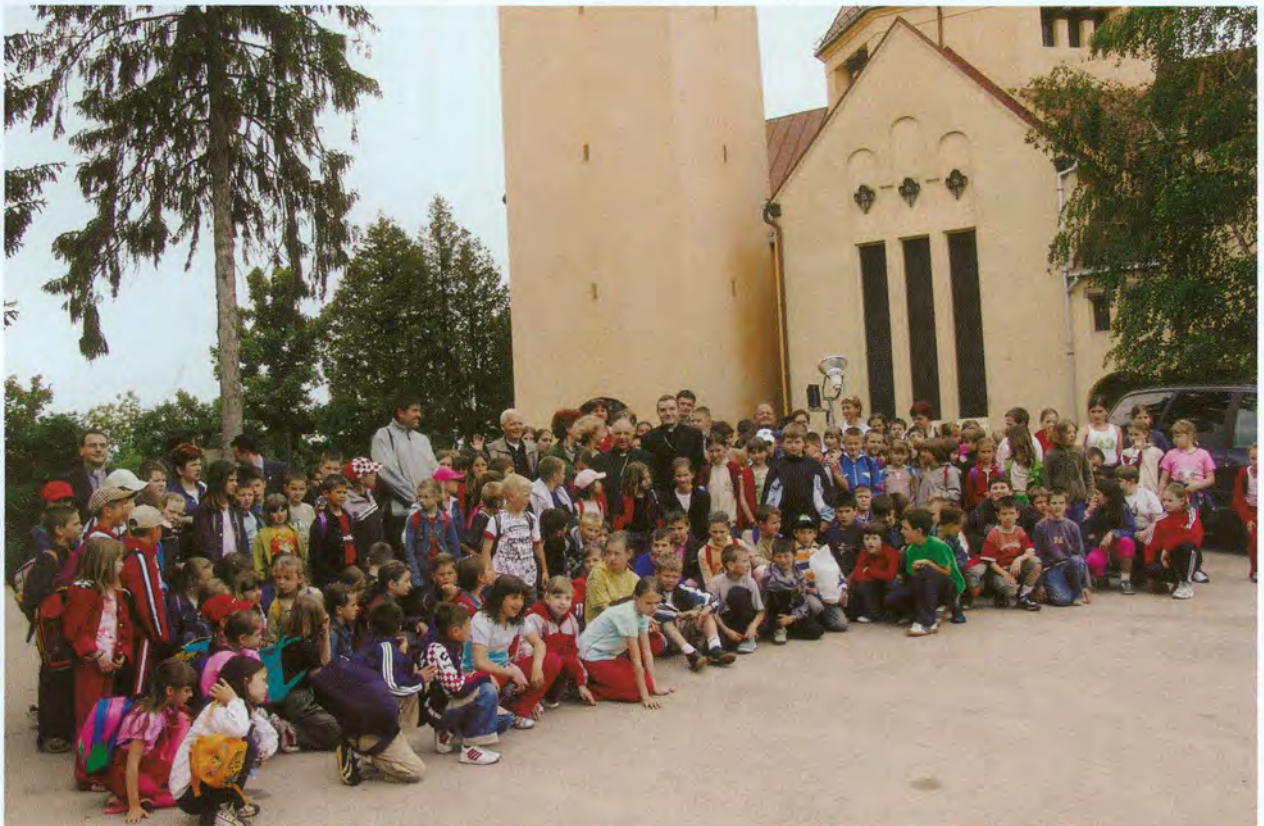
Skupina učenika od 1. do 4. razreda, predvođena svojim učiteljima, hodočastila je u Krašić, 1. lipnja 2004. Za uspomenu su se uslikali s dvojicom kardinala koji su toga dana hodočastili u Krašić. Bili su to njihov nadbiskup kardinal Josip Bozanić i kardinal Dionigi Tettamanzi, nadbiskup milanski.