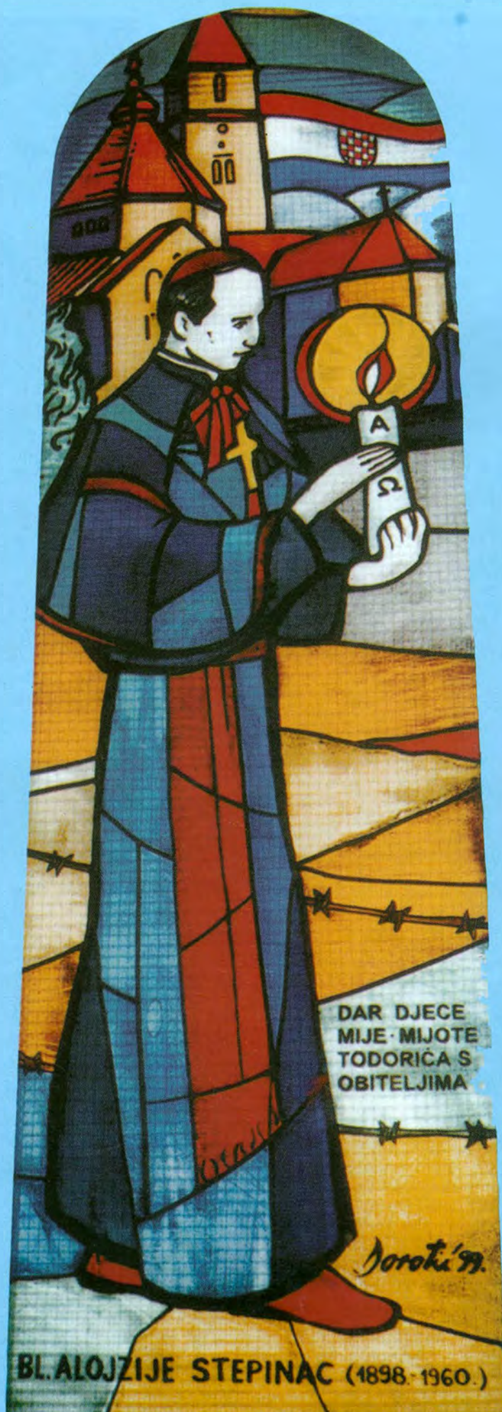
Vitraj na prozoru župne crkve Svih Svetih u Zmijavcima, koji je po narudžbi župnika fra Vinka Prlića izradio Branimir Dorotić iz Zagreba. Postavljen je 10. veljače 1999.