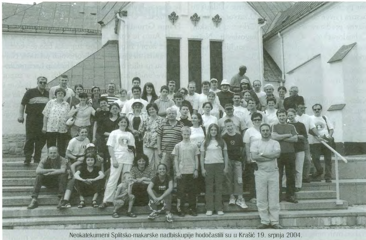
Neokatekumeni Splitsko-makarske nadbiskupije hodočastili su u Krašić 19. srpnja 2004.

kate ovdje? Biskup je već u Purgu!» Radi mnoštva ljudi nisu se komunisti usudili napasti biskupa kod kapele, nego su dobili novo naređenje, da ga dočekaju na putu, kada se bude vraćao u Lepoglavu na objed.