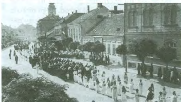
Na euharistijskom kongresu u Čakovcu 1935. sudjelovale su brojne katoličke organizacije