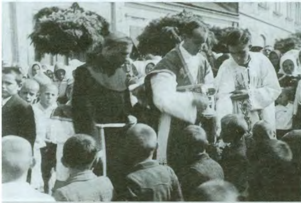
Nadbiskup koadjutor dr. Alojzije Stepinac pričešćuje djecu prilikom euharistijskog kongresa u Čakovcu 1935. Na tome kongresu podjeljeno je 30.000 pričesti.

franjevačkog kolegija iz Varaždina. Brojan narod nije mogao stati u veliku župnu crkvu, nego se zbio na trg pred njom, ali kako su bili instalirani megafoni, mogao je pratiti i vani crkvene obrede i propovijed nadbiskupa koadjutora, kojim je Kongres otvoren. (Op. ur.: Nažalost, nije nam poznat sadržaj ove Blaženikove propovijedi)