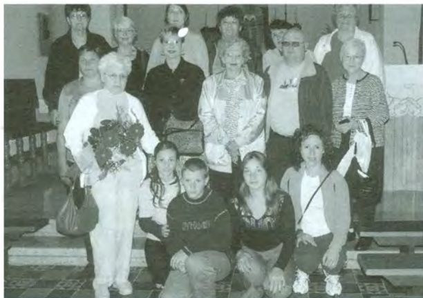
Župljani grkokatoličke župe sv. Nikole iz Clevelanda u SAD-u, podrijetlom iz Žumberka, pohodili su mjesto Blaženikova sužanjstva, 2. srpnja 2004.

govore na trgu ispred crkve uputili su mons. Matija Stepinac, jedan od organizatora festivala, i Miro Mahečić, koji je govorio o filmu kao važnom mediju koji ulazi u stvarnost života. Festival je, kao izaslanik pokrovitelja pomoćnog zagrebačkog biskupa Josipa Mrzljaka, otvorio ravnatelj Glasa Koncila Nedjeljko Pintarić, istaknuvši značenje filmskog stvaralaštva i promicanja kršćanskih vrednota na filmu.