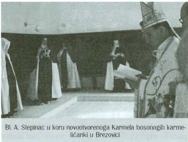
Bl. A. Stepinac u koru novoootvorenoga Karmela bosonogih karmelićanki u Brezovici

U novoj crkvi posvećenoj bl. Alojziju Stepincu na brdu Malački, ponad Kaštela, i nove župe Kraljice mučenika u Radunu, koja graniči sa župom sv. Petra u Kaštel Novom, na uočnicu Dana domovinske zahvalnosti, nakon blagoslova, proslavljeno je 4. kolovoza prvo misno slavlje.