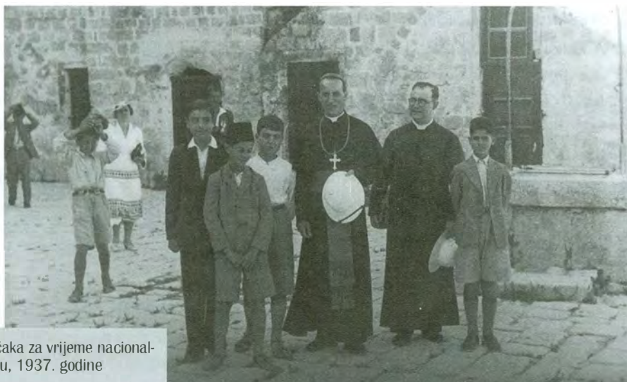
Nadbiskup Stepinac sa skupinom dječaka za vrijeme nacionalnog hodočašća u Svetu Zemlju, 1937. godine

Knjigu Susret u Emausu možete nabaviti ili naručiti na adresi Postulature (Kaptol 31, 10000 Zagreb). Cijena knjige je 50 kn + poštarina.