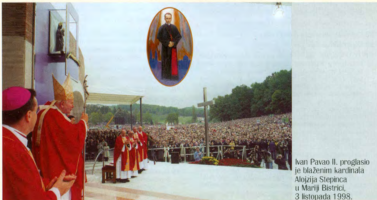
Ivan Pavao II. proglasio je blaženim kardinala Alojzija Stepinca u Mariji Bistrici, 3 listopada 1998.

Blagoslovljen budi 'Oče Gospodina našega Isusa Krista, Oče milosrđa i Bože svake utjehe' (2 Kor 1, 3) za ovaj novi dar Tvoje milosti. Blagoslovljen budi, Jedinorođeni Sine Božji i Spasitelju svijeta, zbog Tvojega slavnog Križa, koji je u zagrebačkom nadbiskupu kardinalu Alojziju Stepincu postigao divnu pobjedu. Blagoslovljen budi Duše Oca i Sina, Duše Tješitelju, koji nastavljaš očitovati svoju svetost u ljudima i koji ne prestaješ djelovati kako bi napredovalo djelo spasenja. Trojedini Bože, danas Ti želim zahvaliti za čvrstu vjeru ovoga Tvoje puka unatoč ne malim protivštinama što ih je susretao tijekom stoljeća. Želim Ti zahvaliti za nebrojene mučenike i ispovjednike vjere, muževe i žene svih životnih dobi, koji su živjeli u ovoj blagoslovljenoj zemlji!«