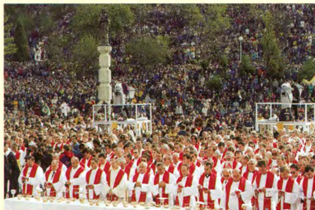
»Plod zemlje i rada ruku čovječijih postat će nam kruhom života« - pripremljene hostije za posvetu i pričest na misi proglašenja blaženim kardinala Stepinca, u Mariji Bistrici, 3. listopada 1998.

2. Vraćajući se mislima u Dvoranu posljednje večere, prošle sam godine, upravo na Veliki četvrtak, potpisao encikliku Ecclesia de Eucharistia , iz koje bih sada htio preuzeti nekoliko odlomaka koji nam mogu pomoći,