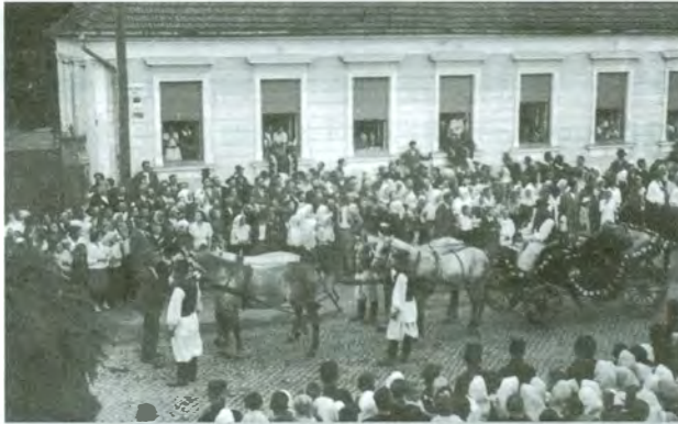
Nadbiskupa A. Bauera i koadjutora A. Stepinca među brojnim narodom u svečano okićenoj kočiji, praćenju s tisuću biciklista i seljačkom konjicom, voze prema župnoj crkvi u Čakovcu uoči euharistijskoga kongresa 1935.

Nadbiskupi su tu ušli u vlak prema Čakovcu. Na peronu je svirala glazba organizacije sv. Vida varaždinskih željezničara sve do odlaska vlaka. Peron je bio krcat građanstva grada Varaždina, koje je živo aklamiralo hrvatske nadbiskupe. Nadbiskupima i tajniku Apostolske nuncijature darovani su lijepi buketi cvijeća.