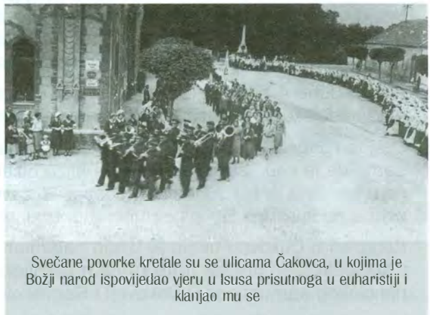
Svečane povorke kretale su se ulicama Čakovca, u kojima je Božji narod ispovijedao vjeru u Isusa prisutnoga u euharistiji i klanjao mu se

tramvajskih namještenika iz Zagreba s 50 glazbenika. Ti se prizori ne daju opisati. Tisuće ljudi padale su na koljena, da dobiju blagoslov od svojih crkvenih poglavara, drugi su se poredali u duge redove i klicali, treći su pjevali svete pjesme, četvrti molili na glas krunicu i litanije. Uzvici mladića i muževa miješali su se s tihom molitvom starica i staraca, kojima se na očima blistale suze, što vide svoje crkvene poglavare. Zagrebački nadbiskup i hrvatski metropolit bio je posljednji put na kanonskoj vizitaciji u Međimurju godine 1912.