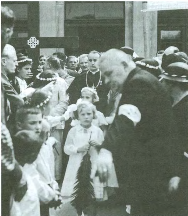
Hrvatsko nacionalno hodočašće u Svetu Zemlju 1937. vratilo se u Zagreb. Nadbiskupa koadjutora A. Stepinca i hodočasnike dočekali su brojni vjernici. Hodočasnički križ koji se vidi na slici danas se čuva u crkvi Ranjenoga Isusa u Ilici, u Zagrebu, a hodočasnička zastava u Spomen-zbirci bl. A. Stepinca na Kaptolu 31.

Novo zvono zamijenilo je staro, koje je od dotrajalosti napuknulo. Naime, staro je zvono bilo u službi od daleke 1908. godine, kada je i izgrađena kapelica Majke Božje Snježne u Trnovcu.