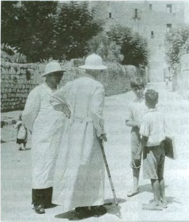
Nadbiskup Stepinac (oslonjen na štap) u razgovoru s dječacima za vrijeme nacionalnog hodočašća u Svetu Zemlju, 1937. godine

Alojzija Stepinca, te autorica Nevenka Nekić. Pred brojnim Selčanima i gostima koji su tih dana hodočastili Gospi Karmelskoj ili provode odmor na otoku Braču, pročitani su tekstovi iz same knjige, predložene povijesne činjenice na temelju kojih je knjiga nastala i o kojima govori, te obrazložena aktualnost žrtava pobijenih partizanskom i okupatorskom rukom u teškom razdoblju hrvatske povijesti za vrijeme 2. svjetskog rata i poslije njega.