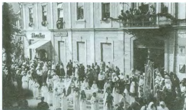
Na Euharistijskom kongresu u Čakovcu sudjelovala su brojna djeca i mladež