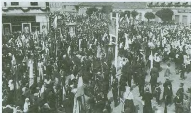
Vjernici se nakon velikih trodnevnih svečanosti prilikom euharistijskog kongresa u Čakovcu 1935. spremaju na povratak svojim kućama puni svetog oduševljenja