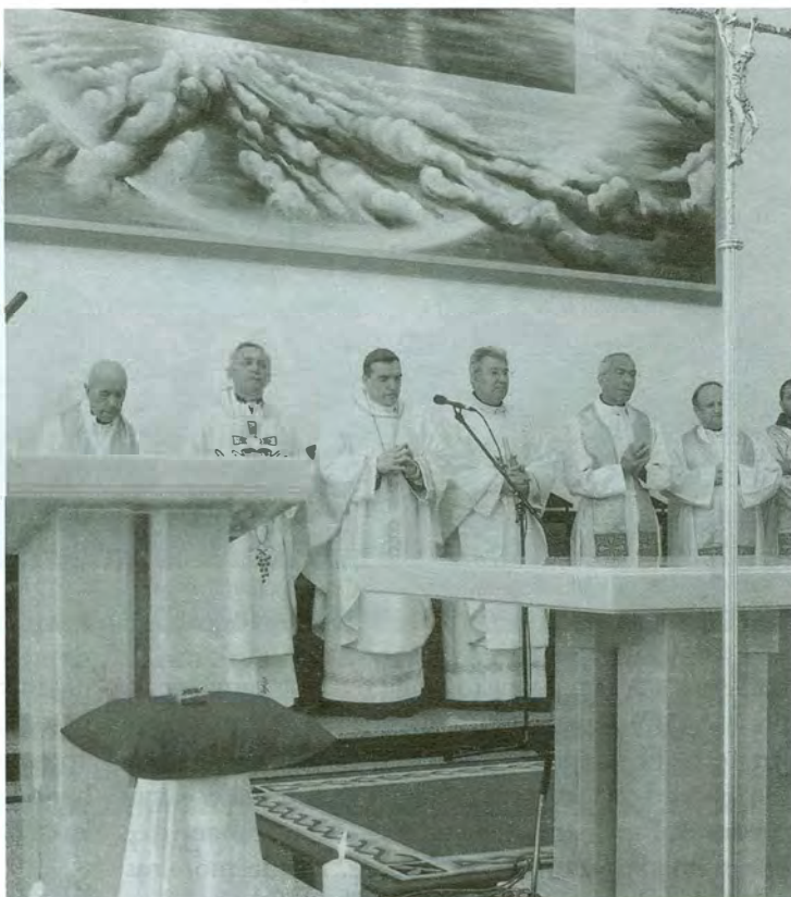
Nadbiskup i kardinal Josip Bozanić ugradio je u oltar župne crkve Dobroga Pastira u zagrebačkom naselju Brestju moći bl. A. Stepinca, u nedjelju, 2. svibnja 2004.