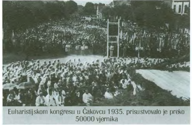
Euharistijskom kongresu u Čakovcu 1935. prisustvovalo je preko 50000 vjernika