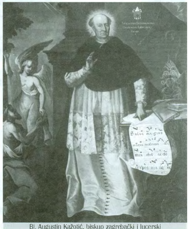
Bl. Augustin Kažotić, biskup zagrebački i lucerski

Sudbina obojice ovih pastira bila je gotovo identična. Čuvajući poklad zdravog nauka, ostajući vjerni u apostolskoj predaji i navještaju evanđelja, obojica su zbog oholosti zemaljskih vlastodržaca stavljeni u