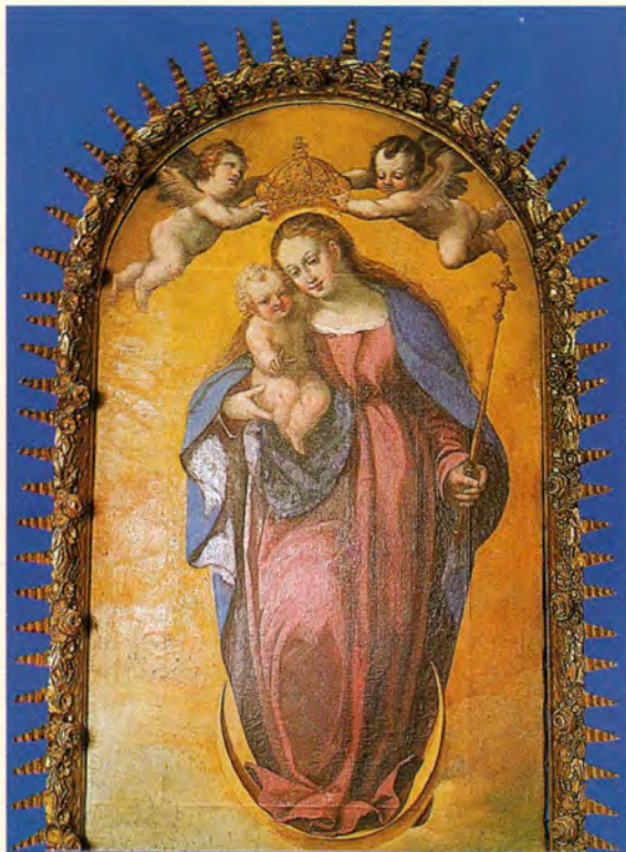
Čudotvorna slika Majke Božje u svetištu u Volavju pred kojom se bl. Alojzije često molio u vrijeme mladosti